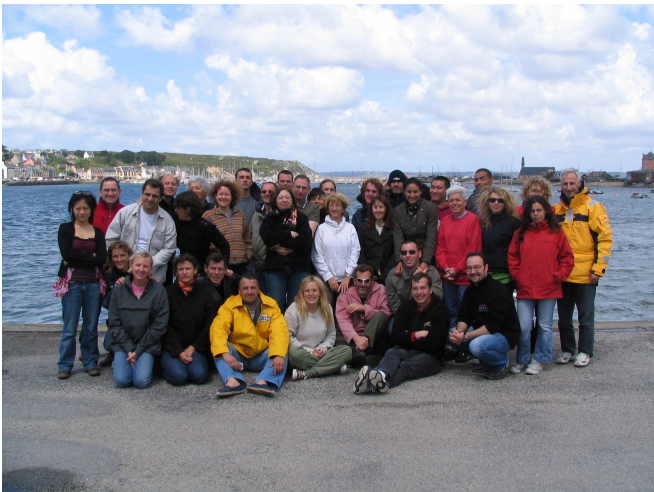
FIGURE 6 – Le groupe de plongeurs

Camaret-sur-Mer est une commune française du département du Finistère, en région Bretagne.