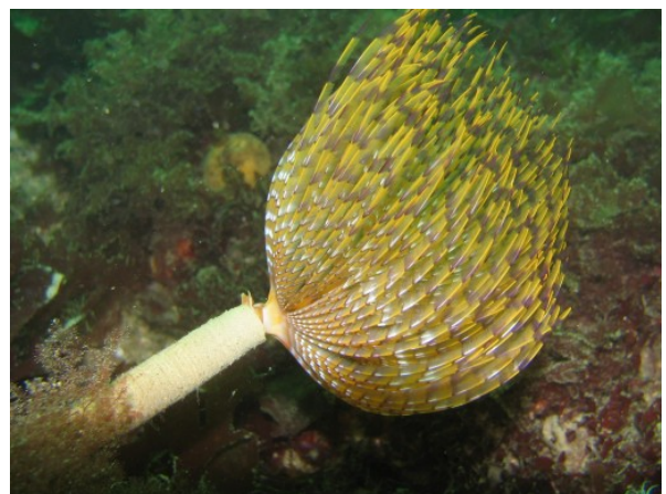
FIGURE 3 – Sabella spallanzanii dit "Spirographe".