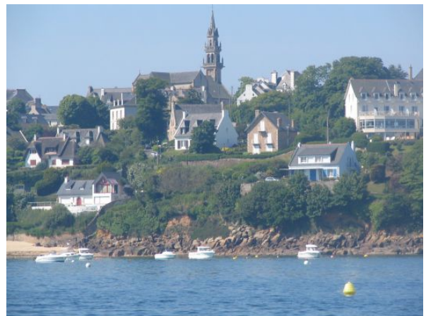
FIGURE 2 – La baie de Carantec

Carantec est une commune du département du Finistère, dans la région Bretagne, en France de la baie de Morlaix.