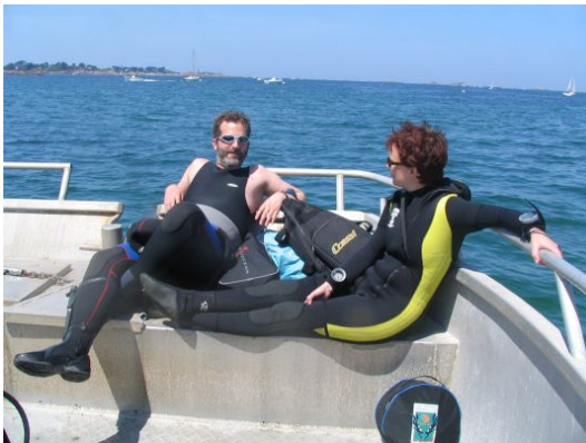
FIGURE 5 – Plongeurs au repos